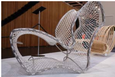
Orgatec 2004

Fragen der Gestaltung, Technologie und Kommunikation werden als integrativer Prozess im Unternehmen verstanden.