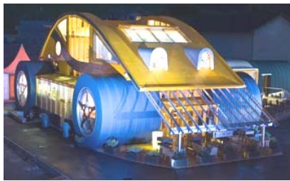
Das Autohaus – The Car